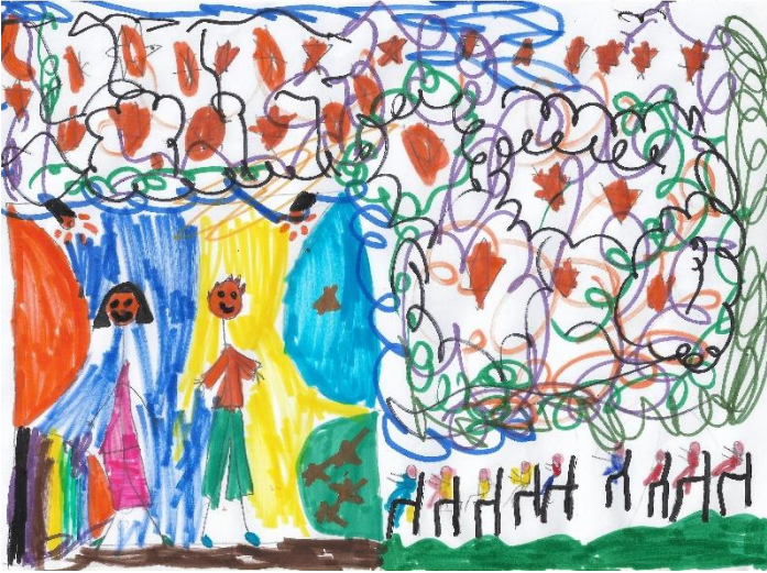
Η Νεφέλη με τη Θεατρική Ομάδα Κωφών «ΤΡΕΛΑ ΧΡΩΜΑΤΑ».

Την επόμενη ημέρα συναντήθηκαν και είπαν τα νέα τους και το τι είχαν καταφέρει όλα αυτά τα χρόνια. «Μάτια που δεν βλέπονται γρήγορα λησμονιούνται» είπε με παράπονο ο Λεωνίδας. Ευτυχώς που υπάρχουν ΜΑΤΙΕΣ ΠΟΥ ΑΚΟΥΝΕ και ακούνε πολλά και μας φέρνουν κοντά » ΤΟΝ