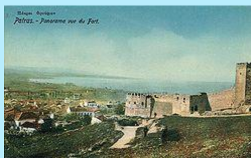
Το φρούριο της Πάτρας, σε απεικόνιση του περασμένου αιώνα

Το Κάστρο της Πάτρας , μεγάλο βυζαντινό οχυρωματικό έργο, χτίστηκε κατά το δεύτερο μισό του βου μ.Χ. αιώνα, επάνω στα ερείπια της αρχαίας Ακρόπολης. Βρίσκεται σε ένα χαμηλό λόφο του Παναχαϊκού σε απόσταση 800 μέτρων περίπου από την ακτή. Τα τείχη του περικλείουν μία έκταση 22.725 τ.μ. και αποτελείται από έναν τριγωνικό εξωτερικό περίβολο, ενισχυμένο με πύργους και προμαχώνες, που προστατεύονταν αρχικά από βαθιά τάφρο και ένα εσωτερικό περίβολο που υψώνεται στη Β.Α. γωνία και επίσης περιβάλλεται από τάφρο.