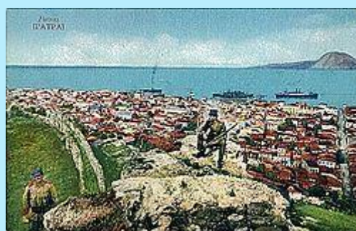
Άποψη της πόλης από το φρούριο, από επιστολικό δελτάριο του περασμένου αιώνα

Οι Φράγκοι σταυροφόροι, το μεγάλωσαν, το ενίσχυσαν και άνοιξαν τάφρο στις τρεις πλευρές του. Το 1278 υποθηκεύτηκε στο Λατίνο Αρχιεπίσκοπο ενώ το 1408 παραχωρήθηκε από τον Πάπα για πέντε χρόνια και έναντι μισθώματος, στους Ενετούς. Στα χέρια του